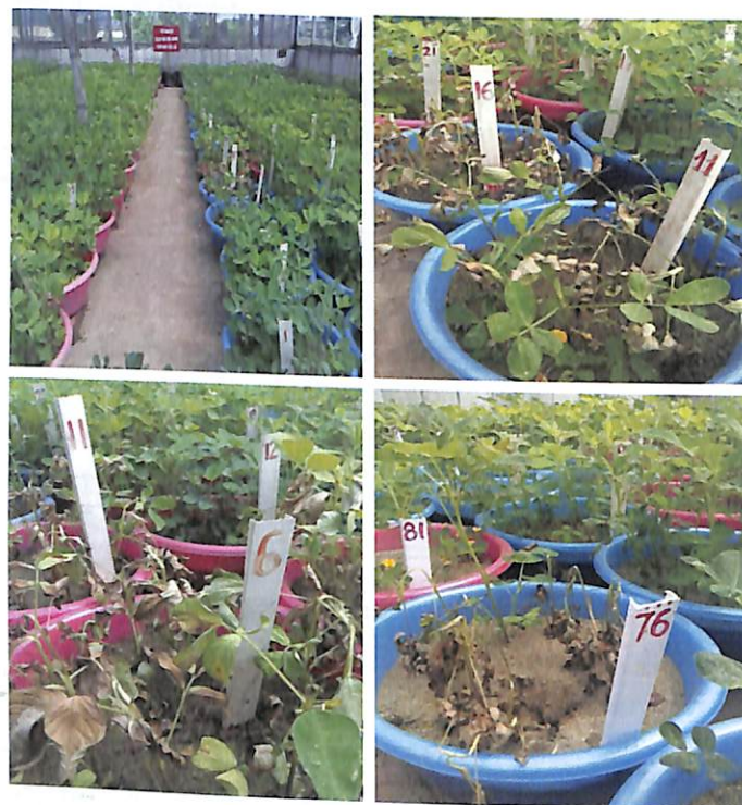
Hình 3. Thí nghiệm đánh giá mức độ héo và khả năng phục hồi của các dòng/giống lạc ở giai đoạn ra hoa rộ tại Thanh Trì, Hà Nội (tháng 11/2016).

rộ (hình 3) cho thấy, có 62/179 dòng/giống bị héo ở mức điểm 3 (chiếm 34,6%), 89/179 dòng/giống bị héo ở mức điểm 4 (chiếm 49,7%), còn lại 28/179 dòng/giống bị héo ở mức điểm 5 (chiếm 15,6%) và không có dòng/giống nào bị héo ở điểm 1, điểm 2.