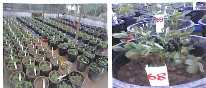
Hình 2. Thí nghiệm đánh giá khả năng chịu hạn dựa vào độ ẩm cây héo tại Thanh Trì, Hà Nội (tháng 10/2016).

Qua quan sát và đánh giá khả năng chịu hạn của 179 dòng/giống lạc trong điều kiện nhà lưới có mái che (hình 2) cho thấy, khi khô hạn xảy ra ở thời kỳ ra hoa đã làm thay đổi rõ rệt chiều cao thân chính và khả năng sinh trưởng của lạc. Ở điều kiện hạn, tất cả các dòng/giống đều bị giảm chiều cao thân chính so với chính nó ở điều kiện được tưới nước đầy đủ (đối chứng).