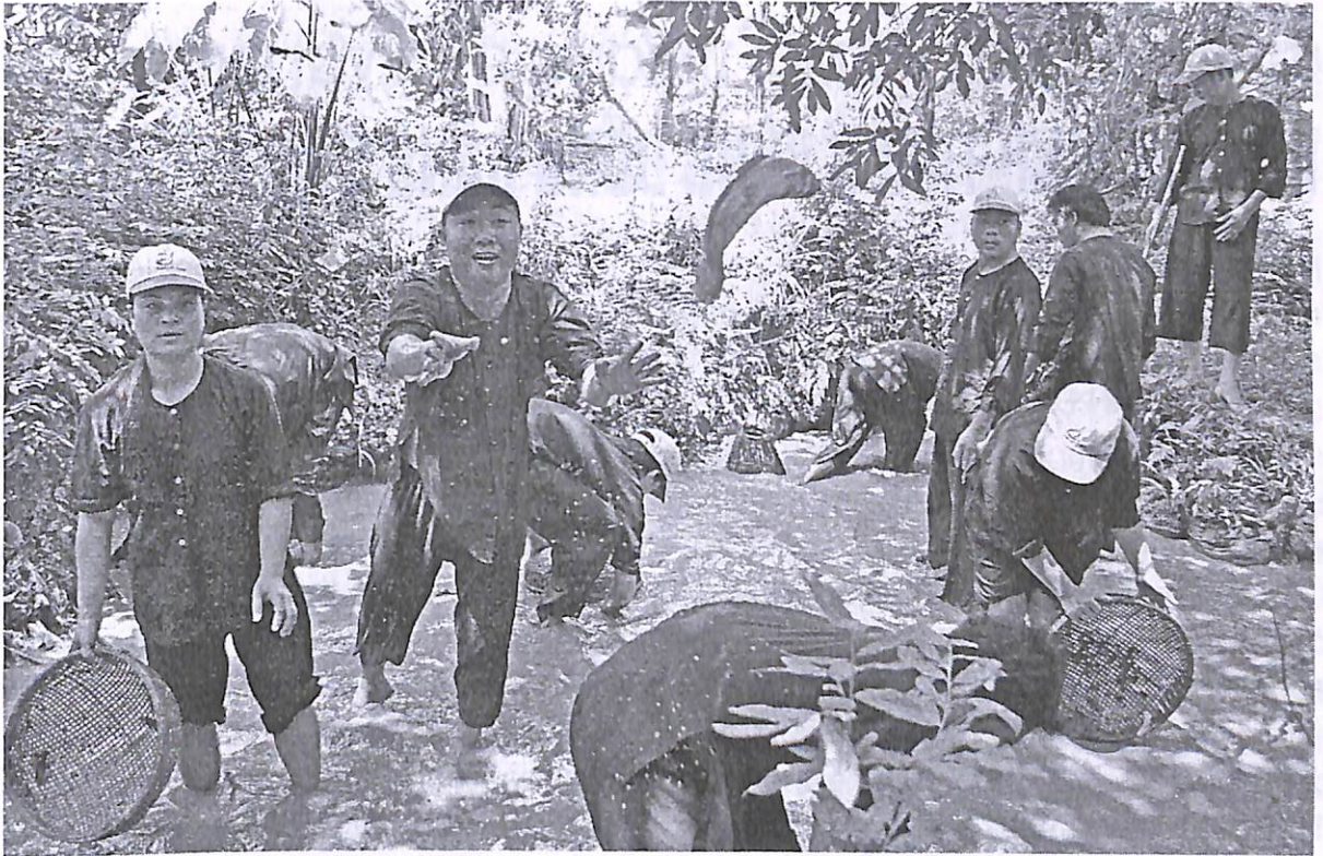
Du khách trải nghiệm tát ao bắt cá tại khu du lịch Vinh Sang, huyện Long Hồ

Đẩy mạnh ứng dụng tiến bộ khoa học công nghệ để phát triển các sản phẩm nông nghiệp sạch, công nghiệp - tiểu thủ công nghiệp có chất lượng cao, đáp ứng nhu cầu mua sắm và kích thích tiêu dùng của du khách.