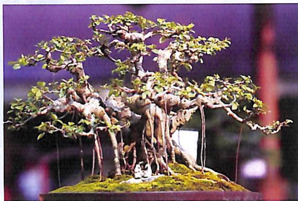
Kỹ thuật trồng cây rất coi trọng việc bón phân đúng cách

Phân bón thường chứa 3 thành phần cơ bản là N, P, K, tương ứng với Nitơ, Photpho, Kali. Nitơ cần cho cành lá, Photpho cần cho