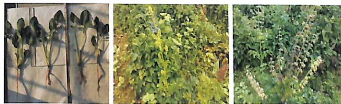
Hình 2. Cây giống đủ tiêu chuẩn trồng và khi ra hoa, kết quả.

có nhiều nhánh nhưng mỗi nhánh có thời điểm ra hoa khác nhau, do vậy quả chín cũng không cùng lúc, bông nở trước sẽ chín trước. Quá trình từ khi cây bắt đầu ra nụ đến khi quả chín cứ liên tục cho đến khi cây tàn lụi.