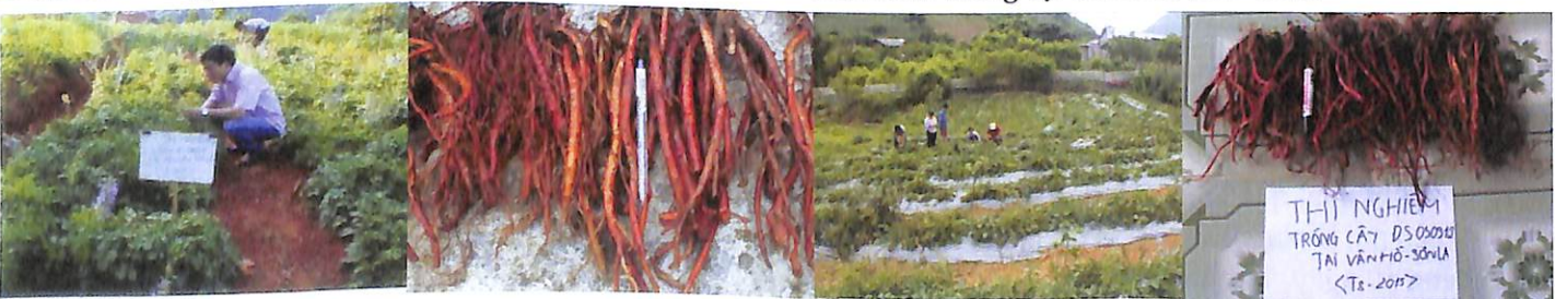
Đan sâm trồng tại Mộc Châu (Sơn La).