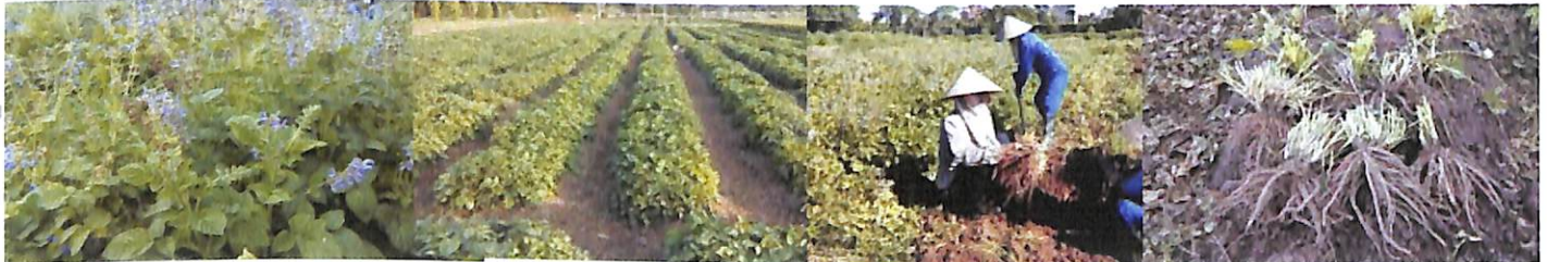
Đan sâm trồng tại Thanh Trì (Hà Nội).

Kết quả bảng 4 cho thấy, năng suất giữa địa điểm ở đồng bằng (Hà Nội) và các điểm miền núi (Sa Pa, Bắc Hà) có sự khác biệt rõ rệt, cao nhất là ở Sa Pa đạt 2,31 tấn khô/ha, sau đó đến Bắc Hà đạt 2,25 tấn khô/ha, năng suất ở Hà Nội chỉ đạt 1,81 tấn khô/ha. Các địa điểm còn lại không có sự khác nhau rõ rệt.