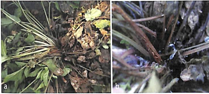
Hình 1: triệu chứng bệnh thối gốc đan sâm: a. Gốc thân bị thối; b. Hạch nấm hình thành ở gốc thân bị bệnh

Tác nhân gây bệnh: nấm R. solani là tác nhân chính được phân lập từ các mẫu bệnh và hạch nấm thu được từ các cây đan sâm bị thối gốc trên ruộng (hình 2). Sau khi lây bệnh 5 ngày, 12 trong số 15 cây đan sâm lây bệnh đều biểu hiện triệu chứng điển hình của bệnh thối gốc, trong khi các cây đối chứng đều không biểu hiện triệu chứng bệnh. Kết quả tái phân lập mẫu bệnh chỉ thu được một loài nấm duy nhất là R. solani . Kết quả này khẳng định, nấm R. solani chính là tác nhân gây bệnh thối gốc cây đan sâm.