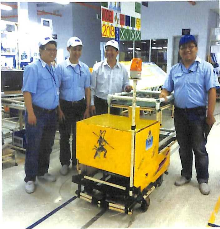
Hình 2: xe tự hành robot AGV, chế tạo tại nhà máy Allied Technology, Khu CNC TP Hồ Chí Minh

tính” (các tập đoàn CNC tên tuổi) đã xứng đáng là sản phẩm CNC rồi. Ngay như những sản phẩm trước nay gọi là “phụ trợ” cho ngành chế tạo ô tô như vỏ bánh xe, thân xe... hiện nay đã được các hãng chế tạo ô tô nâng yêu cầu về chất lượng đến mức ngay những công ty chuyên ngành trước nay ở Việt Nam muốn chế tạo và bán được sản phẩm cũng phải đổi mới công nghệ, nhập thêm trang thiết bị hiện đại, kể cả vật liệu bán thành phẩm như thanh thép, vải bố, thép lá, hợp kim nhôm, khung thép đặc biệt để chế tạo thân ô tô hạng cao cấp.